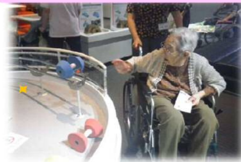
鉄道にかかわる実験もできるよ