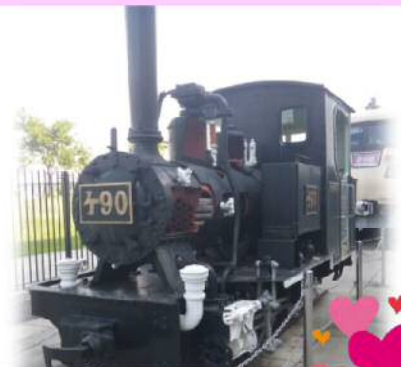
懐かしいSLも展示されていました