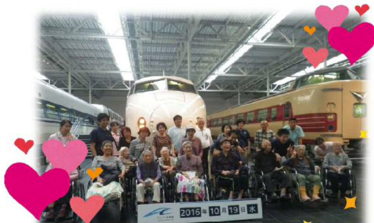
みんなで記念撮影！！