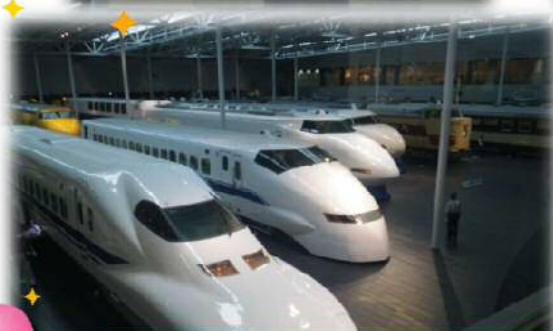
圧巻！歴代の新幹線がズラリ！