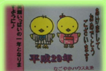
新年のメッセージも添えて…

そのためその1年の 無病息災を願って、 食べるようになった と言われています。 ところで、七草粥に 入っている春の七草 全部ご存知ですか？ 調べてみました～。