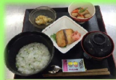
丸池の七草粥定食～

平成29年1月7日 七草粥の日です。 七草は早春にいち早く芽吹くことから、邪気を払うと言われました。