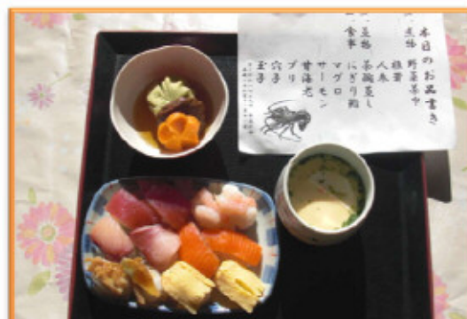
お昼はお寿司に茶碗蒸し、炊き合わせ。

毎年恒例、12月の年忘れ会。今年の昼食はお寿司です。まぐろ、サーモン、甘海老、プリに玉子、そして穴子！皆さんおいしい～！と好評でした。昼食の後は、屋台でのおでん、おしるこ、ケーキ…♡素敵な時間です。今年は大正琴の慰問に琴里会の皆さんが来て下さってとても素晴らしい演奏をきくことができました。また、皆さんお楽しみ？の職員出し物も。楽しんでいただけたでしょうか？また来年もお楽しみに♪