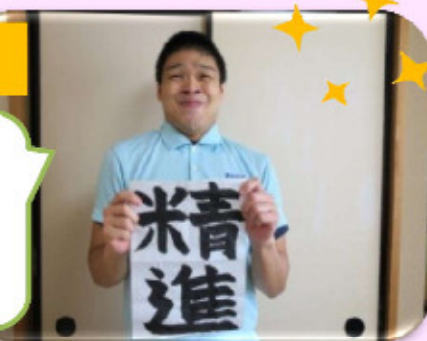
そして、私 猪又介護職員