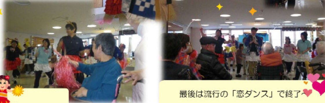
最後は流行の「恋ダンス」で終了♡♡