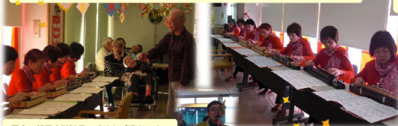
司会の飯見介護職員。盛り上げ担当です⇒