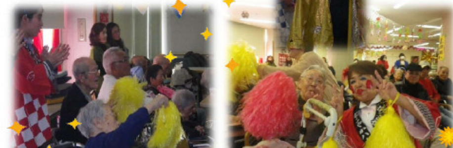
丸池ポンポン隊結成！！みんなファイトー！！